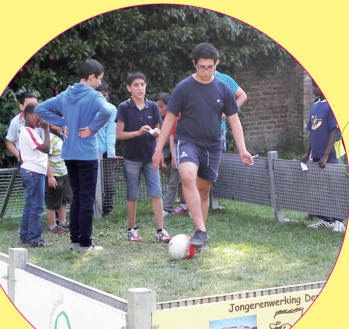
De panakooi van de jongerenwerking en de jongerenwerking in actie