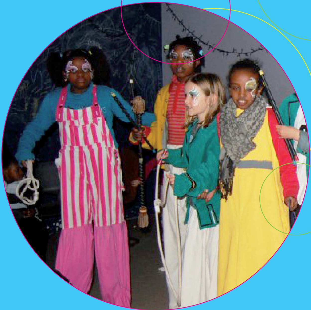
Foto: Kinderwerking Fabota/Buurtwerk 't Lampeke vzw Circuswerking Atobaf