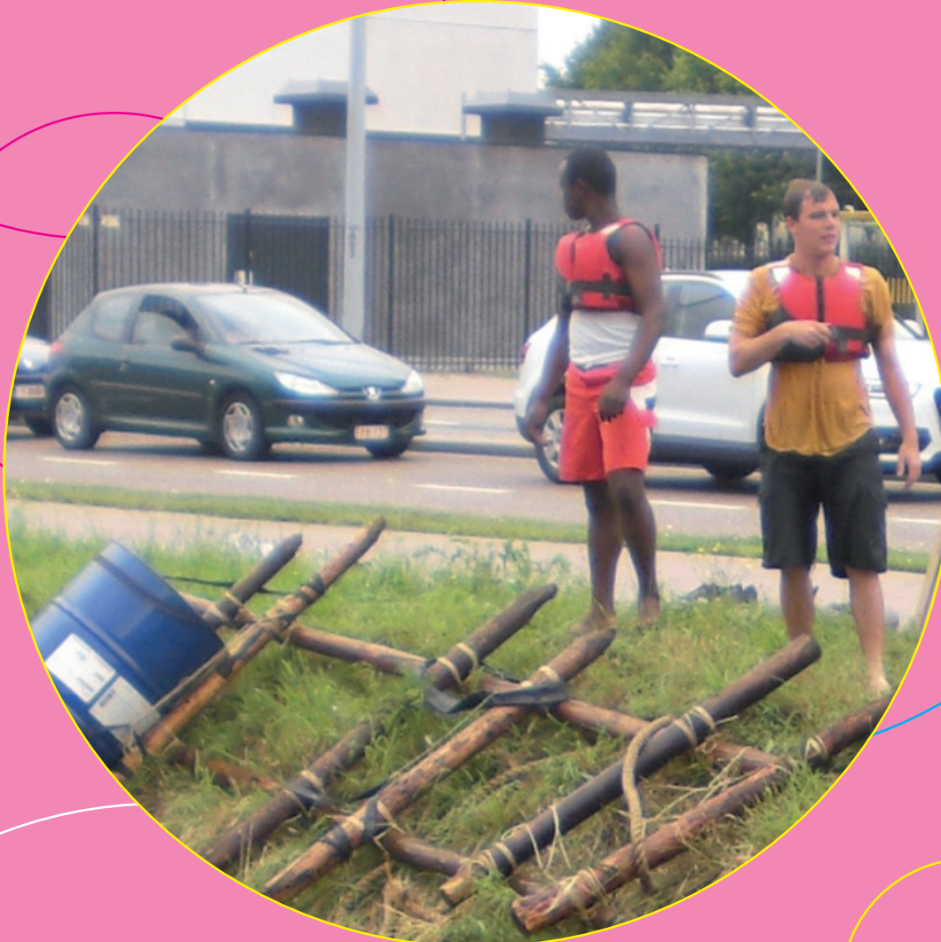
De jongerenwerking in actie