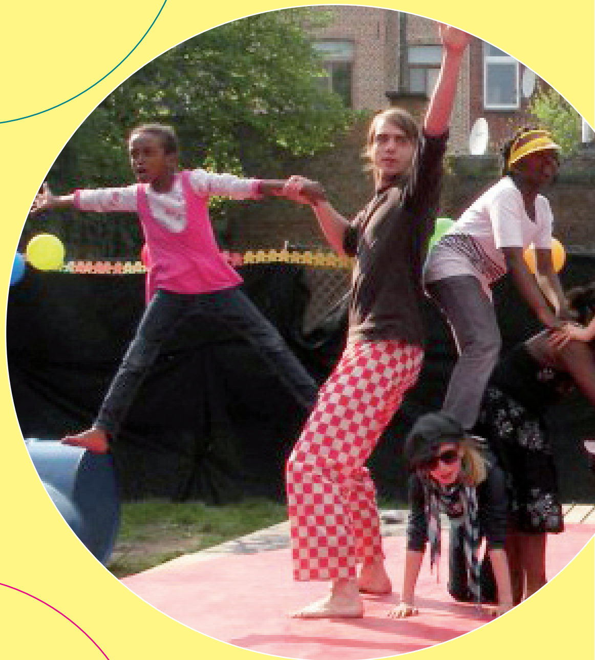
Foto: Kinderwerking Fabota/Buurtwerk 't Lampeke vzw Circuswerking Atobaf