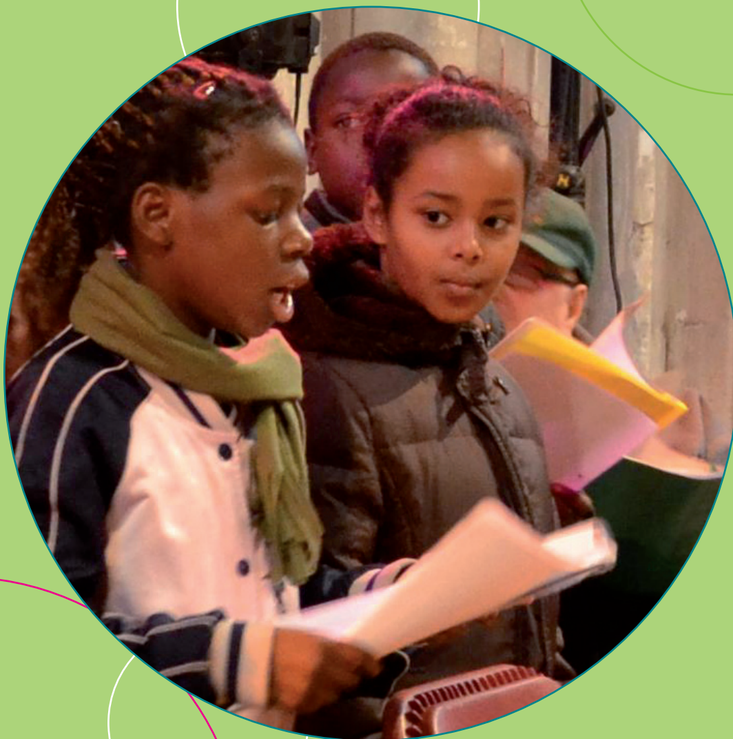
Multicultureel gezinskoor treedt op in de buurt