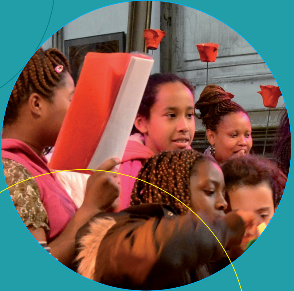
Multicultureel gezinskoor treedt op in de buurt