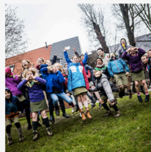
Actieplan op maat