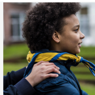
Veilige eerste werkingen