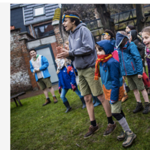
Betrokkenheid bij het aanbod van de jeugddienst