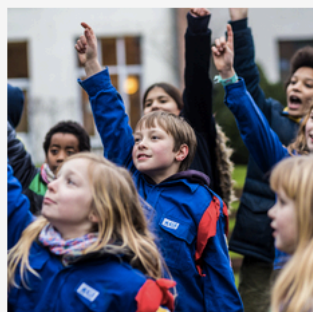
Omgaan met nieuwe