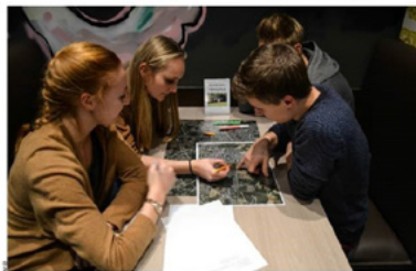
*Jongeren konden op de eerste 'Toogpraat' mee nadaken over het kindvriendelijk gebruik van openbare ruimtes.

BEVEREN De Jeugd Raad wil in 2017 starten met een proefproject waarbij jongeren zelf meedelen over het kindvriendelijk gebruik van openbare ruimtes. Tijdens de eerste 'Toogpraat' konden leden van verschillende jeugdbewegingen al even meedelen.