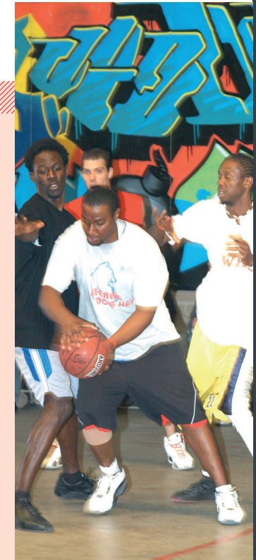
De besproken studie maakt deel uit van een ruimer doctoraatsonderzoek, dat kadert binnen het Steunpunt voor Beleidsrelevant Onderzoek Sport, met steun van de Vlaamse Overheid.

Gebaseerd op de bevindingen uit ons onderzoek kunnen we concluderen dat het programma, via informeel leren, investeerde in het menselijk kapitaal van de deelnemende jongeren. Het bepalen van de netto-uitkomsten van dergelijke programma's is echter zeer moeilijk omdat ontwikkeling zich daarnaast ook manifesteert binnen andere levensdomeinen (bv. school) en door het ouder worden. De ontwikkeling van het menselijk kapitaal van maatschappelijk kwetsbare jongeren, mag daarbij echter niet los gezien worden van de bredere maatschappelijke context en de nodige veranderingen op institutioneel niveau. ■