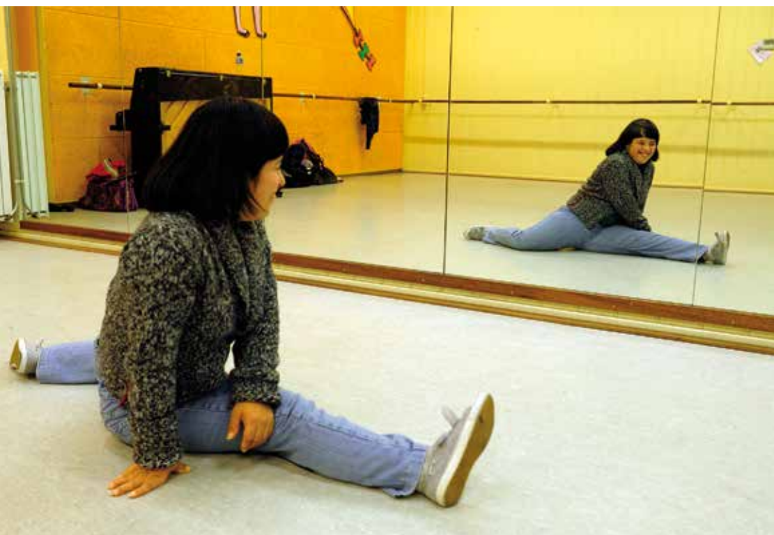
KOM Arnhem: professionele kunsteducatie voor iedereen met een zorgachtergrond

Daarnaast kan ook het werken met mensen met een beperking voor kunstmakers inspirerend zijn. Zij leren werken met een nieuw bewegingsdomein. De kunstenaar